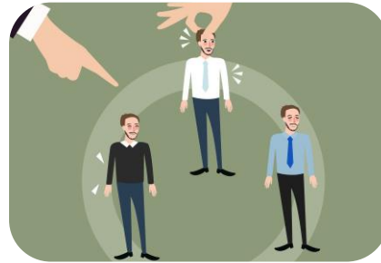
Alta rotación de personal