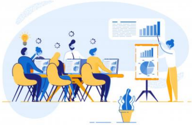
Capacitación inadecuada de servidores públicos