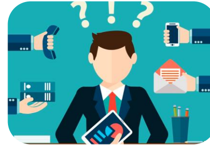
Herramientas técnicas insuficientes